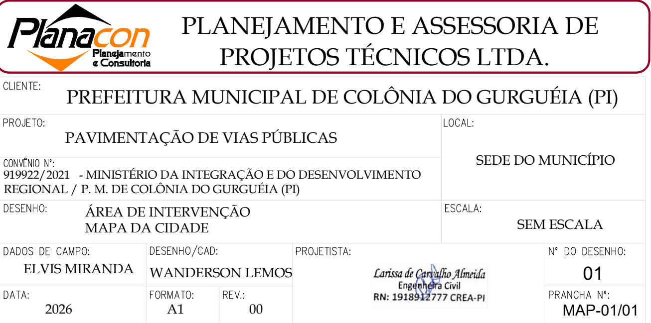
ÁREA DE INTERVENÇÃO